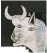
El toro :

Describe cada elemento del cuadro de Picasso y explica lo que simboliza