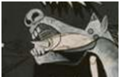
El caballo :