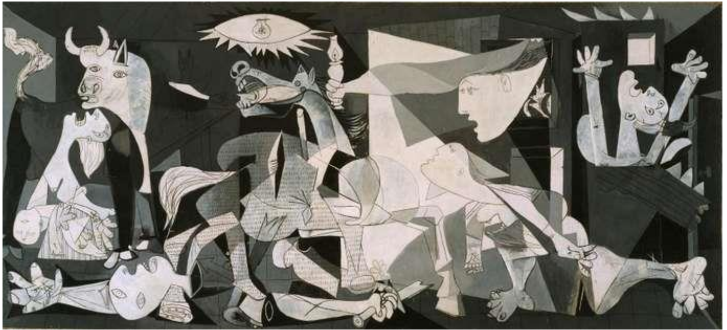
Guernica, 1937, óleo sobre tela, 782x351cm, museo Reina Sofía, Madrid (desde 1981).