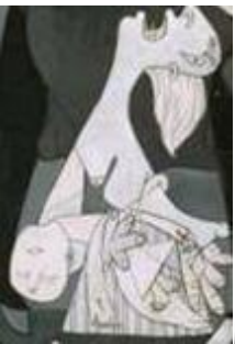
La madre con su hijo muerto :