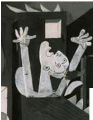
el ciudadano en la casa en llamas :