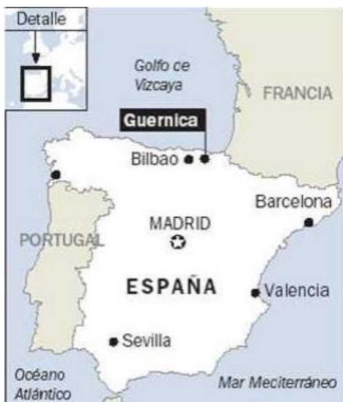
Mapa de España